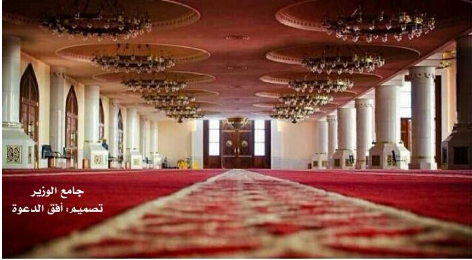
جامع الوزير تصميم: أفق الدعوة

عن أنس بن مالك رضي الله عنه قال: قال رسول الله صلى الله عليه وسلم: